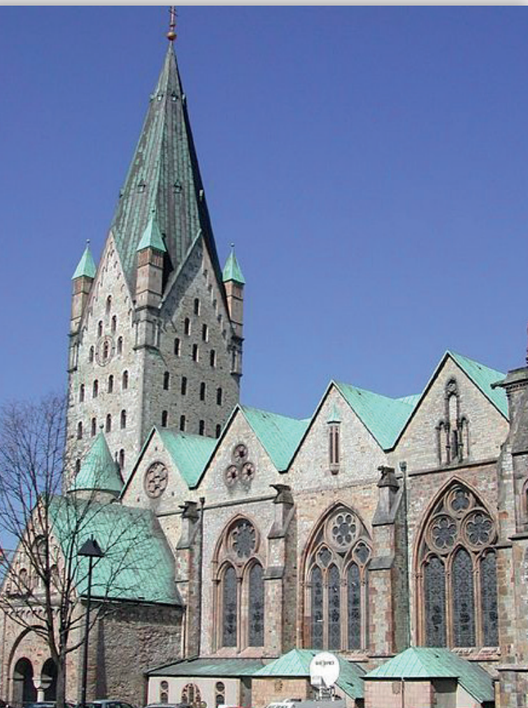
Bildnachweis: Dom zu Paderborn, de.wikimedia Cvoegtle

Am 22. September 2018 führt uns die traditionelle Reise des Freundeskreises ins Westfälische. Ziel ist die Stadt Paderborn. Haben wir uns sonst mit Büchern und ihren Aufbewahrungsstätten befasst, sollen dieses Mal Inhalte, die in vielen Büchern beschrieben werden, im Vordergrund stehen. Wenn ich auf die Reisen des Freundeskreises zurücksehe, stelle ich fest, dass bei jeder dieser Fahrten immer wieder Interessantes und Überraschendes dabei war. Und wenn es nur die Anekdote war, wegen einer Panne unfreiwillig das Verkehrsmittel wechseln zu „dürfen“, und das alles ohne Aufpreis!