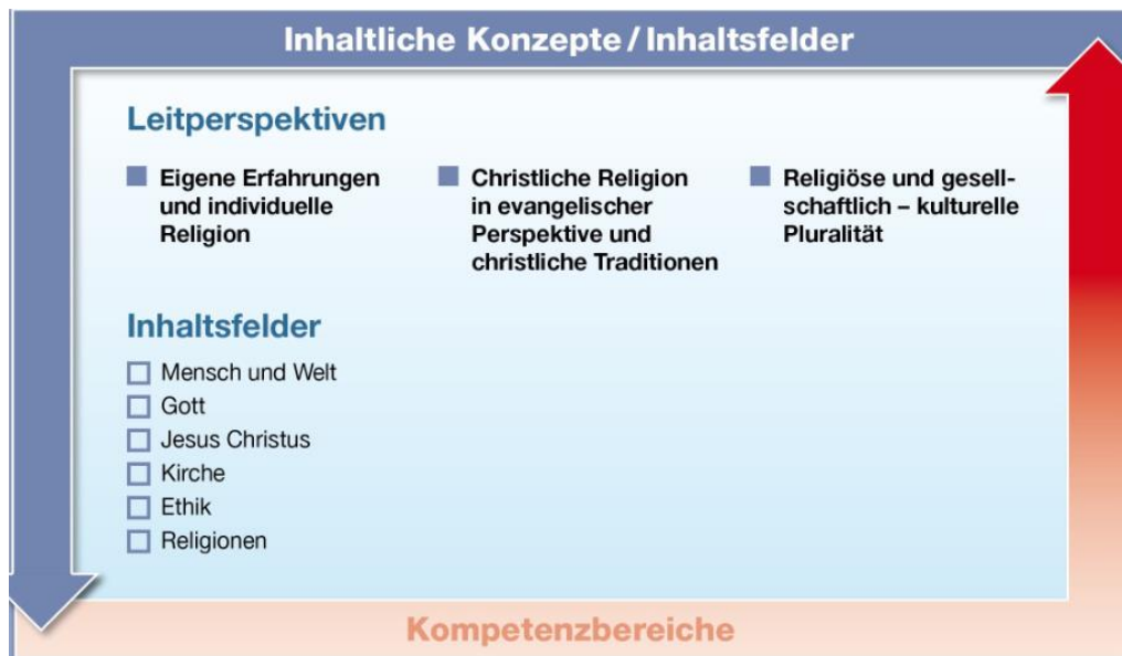
Abbildung 2: Leitperspektiven und Inhaltsfelder im Religionsunterricht

Drei Leitperspektiven sind grundlegend dafür, wie Religion uns in der Lebenswirklichkeit begegnet 172 :