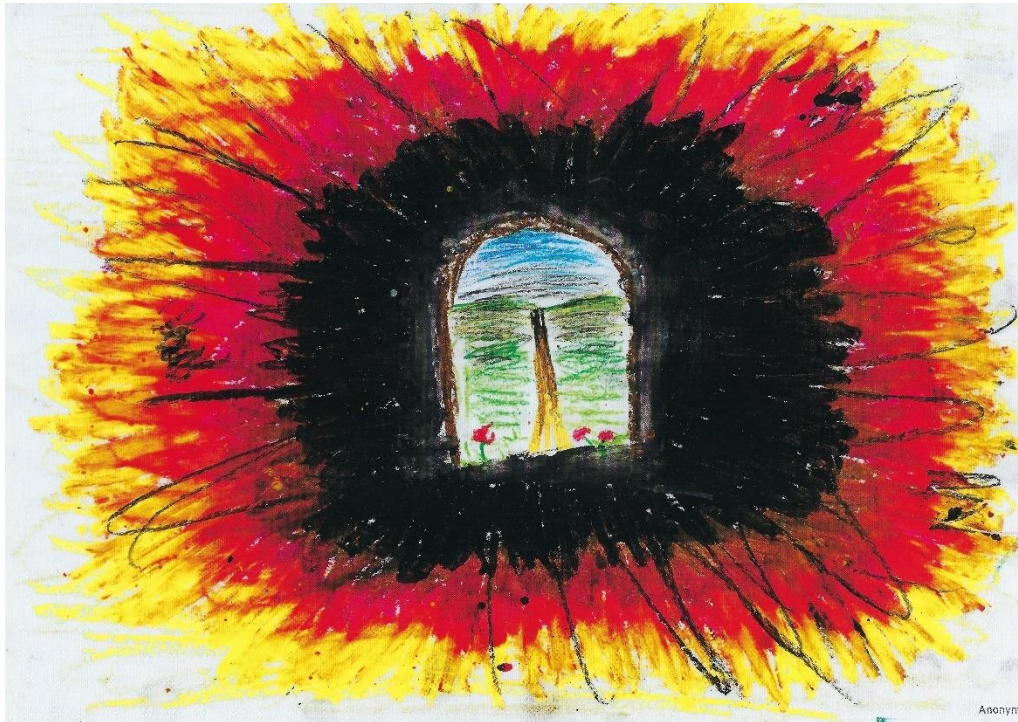
Abbildung 8: Bildkarte „Der Tod als Gericht Gottes“

kann für Kinder und Jugendliche, insbesondere im Umgang mit dem Tod eines geliebten Menschen, unterstützend und hilfreich sein.