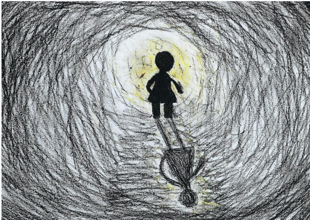
Abbildung 4: Bildkarte „Der Tod als Erlösung vom Leiden“

Die Bildkarte in Abbildung 4 zeigt eine Figur in einem grau-schwarzen Tunnel. Es sieht so aus, als würde die Figur durch den Tunnel in die Richtung eines Lichts gehen und dabei wirft sie einen Schatten zurück in den dunklen Tunnel. Ein Kommentar auf der Rückseite des Bildes stammt von einem 15-jährigen Jungen, namens Quentin: