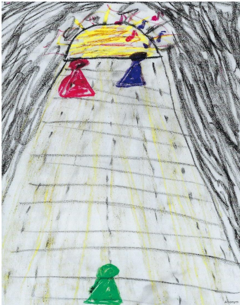
Abbildung 9: Bildkarte „Der Tod und die Nahtod-Erfahrung“