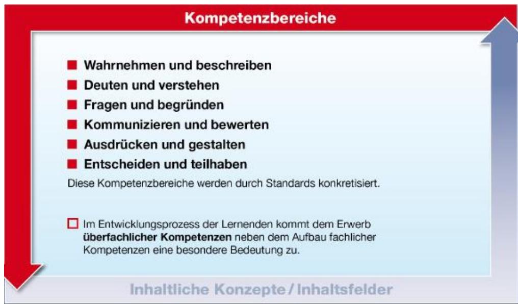
Abbildung 1: Kompetenzbereiche des Faches Evangelische Religion

Für den evangelischen Religionsunterricht werden sechs Kompetenzbereiche unterschieden 171 :