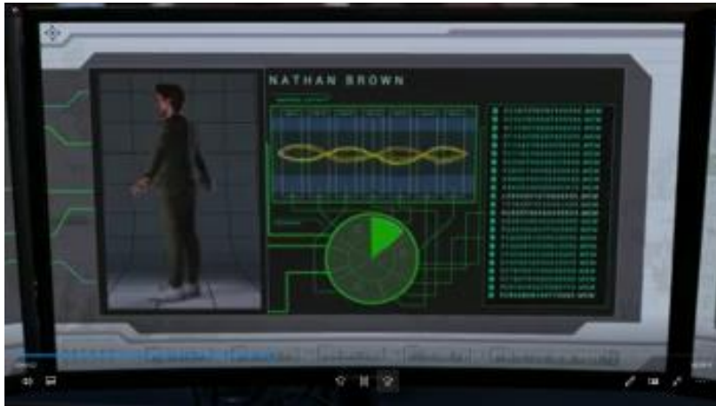
Abbildung 12: „Avatar als leibliche Konstruktion“ 224

Auf diesem Bild kann man sehen, wie Nora den Avatar von Nathan entwirft. Sie öffnet seine Dateien am Computer und entwirft auf den Grundlagen dieser Daten und Erinnerungen seinen Avatar. Theologische Bezüge: Es wird deutlich, dass das Heil, im Sinne einer Erlösung durch die digitale Welt, von den finanziellen Mitteln des Menschen abhängig sind. Die Hinterbliebenen haben Einfluss oder sind gar die Eigentümer. Der Verstorbene hat nach dem Tod Bedingungen zu erfüllen und ist abhängig von den Menschen in der Realität. Hier kann ein Bezug zu den Themen Heil, Schöpfung und Auferstehung hergestellt werden.