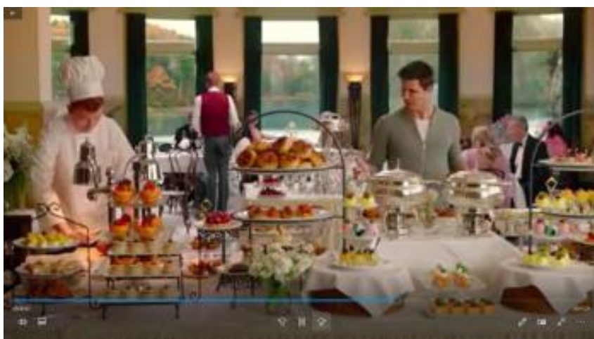
Abbildung 13: „Alles, was das Herz begehrt?“ 225