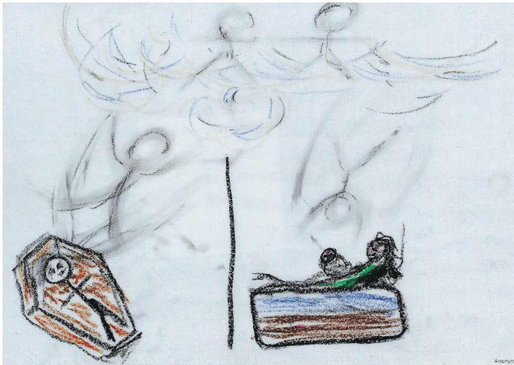
Abbildung 6: Bildkarte „Der Tod als Wiedergeburt“