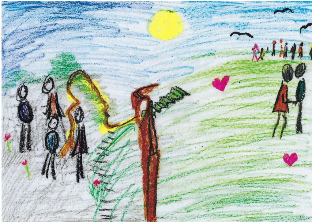
Abbildung 5: Bildkarte „Der Tod als Eingehen ins Paradies“

„Das Leben endet. Der Tod beginnt. Das Alte entfremdet. Das Neue gewinnt. Ich steige empor. Werde dort herzlich empfangen. Eine neue Welt kommt hervor, werde ich zu dieser gelangen? Unendliche Weite erstreckt sich. Und gleichzeitig unendliche Nähe. Ewige Freiheit umgibt mich, Freiheit, wie die der fliegenden Krähe. Eine schützende Hand liegt auf mir, weist mir den Weg. Einen Weg ohne Hass und Gier. Und so stehe ich mitten auf einem Steg. Auf dem Steg ins Paradies.“ 194