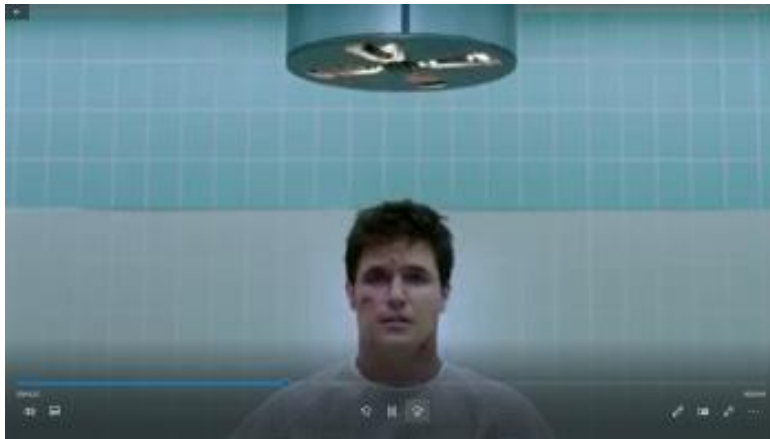
Abbildung 11: „Hochladen von Nathan“ 223

Dieses Bild zeigt Nathan, nach seinem Unfall mit schwerwiegenden Verletzungen, im Krankenhaus. Für den Upload sitzt er auf einem Stuhl. Vor ihm wird eine Wanne aufgestellt. In dieser Szene explodiert während des Vorgangs (Upload) sein Kopf und sein Körper fällt in die Wanne. Der Körper wird tiefgefroren, da bereits an einem neuen „Download des Auferstandenen“ gearbeitet wird. Theologische Bezüge: Welche Bedeutung hat der Körper für die Auferstehung in der Theologie? Besonders interessant scheint hier die Darstellung des eingefrorenen Körpers zu sein und zu schauen welche Rolle der Körper von Jesus Christus in der Theologie spielt.