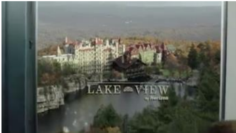
Abbildung 10: Werbefilm: „Lake View – Horizon“ 221

Das Bild ist aus dem Werbefilm für Lake View, welcher in den ersten 30 Sekunden der ersten Folge zu sehen ist. „Wie sieht die Belohnung für ein gutes Leben in einem speziell dafür geschaffenen Upload aus? Leben Sie in der vollkommensten und schönsten Umgebung, die man sich nur vorstellen kann.“