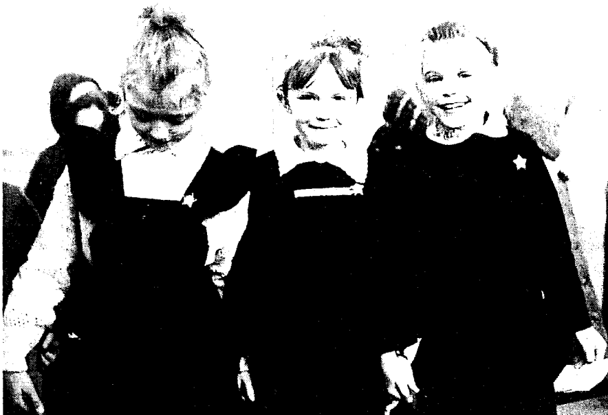
Tausend Kraniche mußt du falten, Bundesrepublik Deutschland 1991