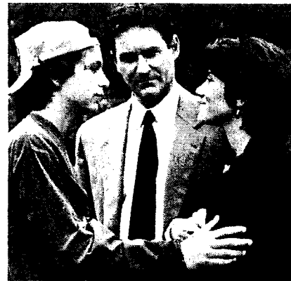
Grand Canyon – Im Herzen der Stadt, USA 1991