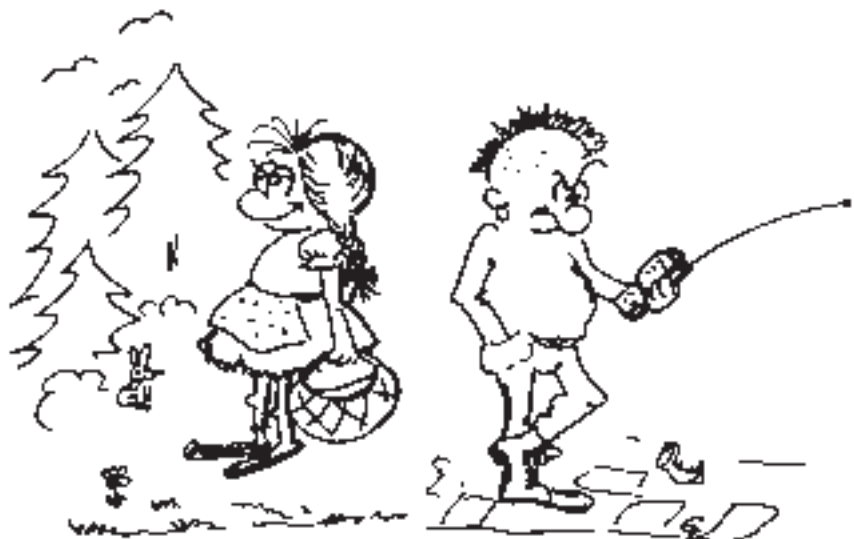
„Heile Welt – zerstörte Welt“

de auch als Pädagoge fragt, wo denn die Welt ist, in der kleine Kinder am besten aufgehoben sind, dann zögert wohl keiner mit der Antwort: In unzerstörter Natur, wo sie zusammen mit anderen Kindern die Welt erkunden können. Mit Sicherheit würde man nicht spontan sagen: in der Großstadt, in der Autowelt. Sie erscheint uns kaum kindgerecht, obwohl zunehmend mehr Kinder in ihr leben. Die autogerechte Welt der Großstadt scheint uns diametral entgegengesetzt zu sein zu einer idealen Kinderwelt. Astrid Lindgren hat uns von der idealen Kinderwelt in ihren Büchern erzählt. Zum Beispiel in „Ronja Räubertochter“. Da macht sich Ronja eines Tages selbstständig, geht aus der Räuberburg, in der sie sich geborgen und wohlfühlt hat, in eine wunderbare neue Welt. Sie durchstreift den Wald und verbringt einen ganzen Tag an einem Teich, wirft Steine ins Wasser, hört den Tieren zu und schläft dann zufrieden ein, wohlbehütet in und von der Natur. Ihr Vater sucht sie dann und holt sie heim.