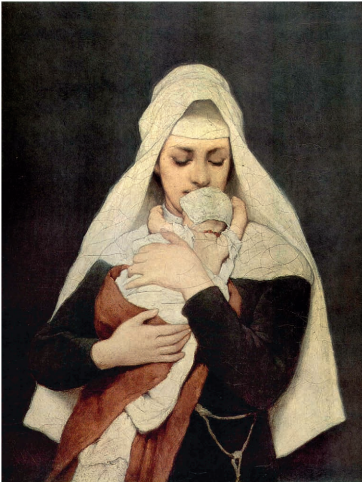
Eine Frau mit einem Findelkind. Ein zwischen 1870 und 1880 entstandenes Ölgemälde des Münchener Historienmalers Gabriel Cornelius von Max.

In fünf ihrer insgesamt 219 Paragraphen ging die „Carolina“ auf Frauen ein, die ihre Schwangerschaft verheimlicht hatten und verdächtigt wurden, heimlich abgetrieben oder sich ihres Kindes nach der Geburt entledigt zu haben. Die intensive juristische Auseinandersetzung mit der Angelegenheit lässt erahnen, dass es sich um ein Massenphänomen gehandelt haben muss. Am häufigsten begingen dieses Verbrechen ledige und mittellose junge Frauen aus den Unterschichten, die sich