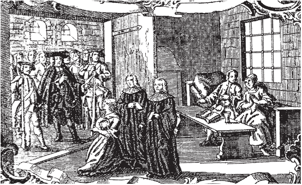
Die Verurteilung einer Kindsmörderin. Ausschnitt aus einem Kupferstich aus dem 18. Jahrhundert, entnommen aus: Dülmen, Frauen vor Gericht, Seite 37.

als Magd oder Tagelöhnerin verdingten. Seelische und materielle Not waren die Auslöser.