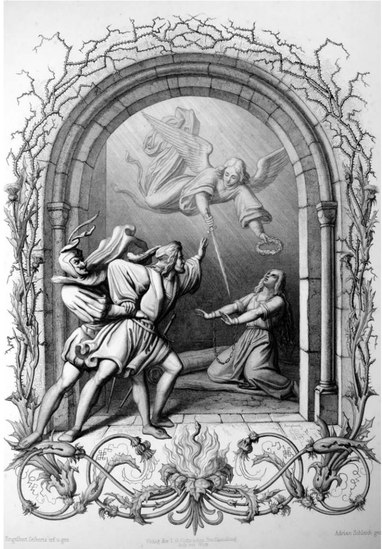
Johann W. von Goethe hat dem verführten und geschwängerten Gretchen in seiner Tragödie „Faust“ ein Denkmal gesetzt – diese Zeichnung von Engelbert Seibertz befindet sich auf Seite 164 einer 1854 in Stuttgart und Tübingen erschienenen „Faust“-Ausgabe, die in der Fürstlich Waldeck-schen Hofbibliothek in Arolsen steht.

nung „Zur Verhütung des Kinder-Mords“ mit ihren Nachträgen als Vorbeugung eines sich sorgenden Landesherrn zu betrachten sind, die eine in Not geratene Schwangere vor einer möglichen Abtreibung oder eine junge Mutter von der Tötung ihres Neugeborenen abzuhalten suchten.