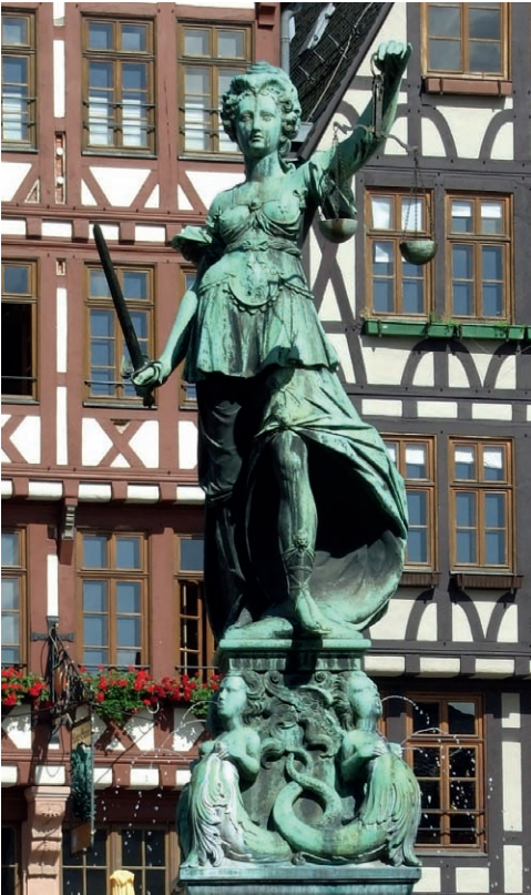
Mütter zu ihrem Recht verhelfen: Die Göttin der Gerechtigkeit, Justitia, mit ihren Attributen Waage und Schwert – die Statue krönt den Gerechtigkeitsbrunnen am Frankfurter Römer.

Die Regierung „hat aber auf die Befolgung dieser Verordnung mit Ernst und Nachdruck zu halten“ und damit sie jedem zur Kenntnis gelange, sollte sie jeden neunten Sonntag nach Trinitatis in der Kirche wiederholt werden. Die Pfarrer unterlagen dabei der Kontrolle durch Inspektoren. Zusätzlich gab die Regierung „zu besserem Verständnis für den gemeinen Mann“ eine Zusammenfassung der einzelnen Paragraphen heraus: die „Summarien“. Ein Exemplar davon sollte jeweils an der Kirchentür angeschlagen werden, drei weitere sollten an den Pfarrer, den Dorfrichter und den Schulmeister in jeder Gemeinde ausgehändigt werden, damit sich jedermann daraus informieren konnte.